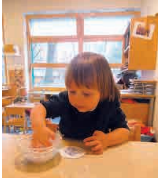
Auch das Schneeflöckchen-Lied brachte uns auf die Idee, aus verschiedenem Papier, weißer Fingerfarbe und Glitzer, Flocken zu tupfen.