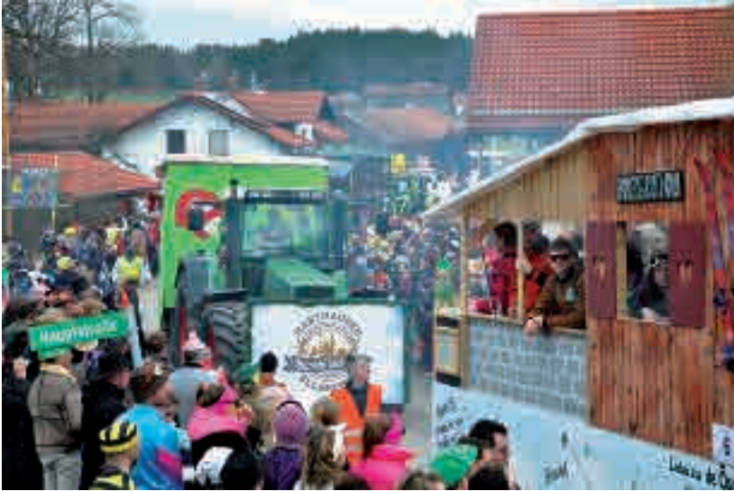
Nach dem letzten Zug von 2020 konnte man nach Corona wieder ohne Einschränkungen ausgelassen den Fasching feiern. Unglaublich, wie viele Wagen, Fußgruppen und Zuschauer sich auf den Weg nach Tattenhausen gemacht haben