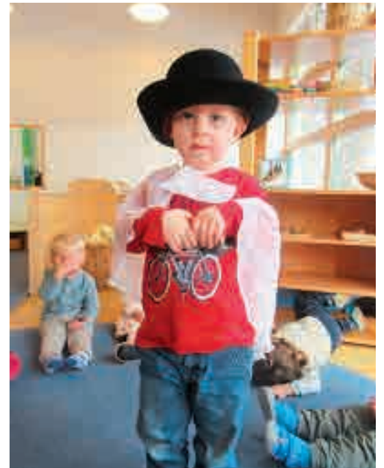
Mit dem Schneemann-Bewegungsspiel-Lied spielten wir eine musikalische Schneemann-Geschichte entweder gleich in der Früh oder im freien Spiel nach.