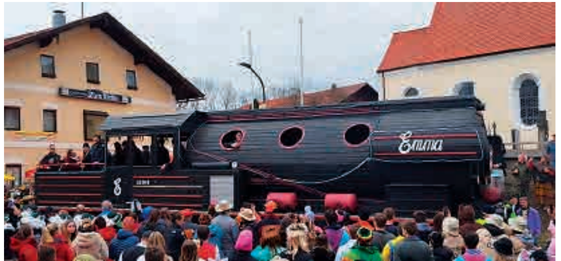
Die Lokomotive Emma aus Dorfen war eines der Highlights des heurigen Umzuges

Die Bad Aiblinger Garde war dieses Jahr auch dabei