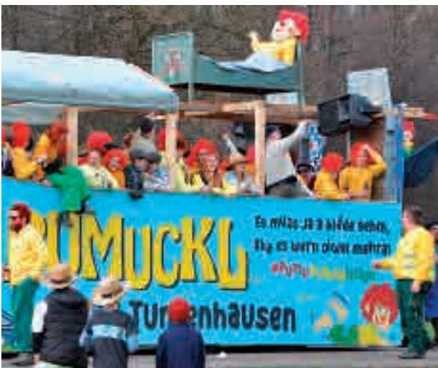
Der Burschenverein Tattenhausen hat einen legendären Satz von Meister Eder zum Anlass genommen, um sich mit der momentanen Politik auseinanderzusetzen