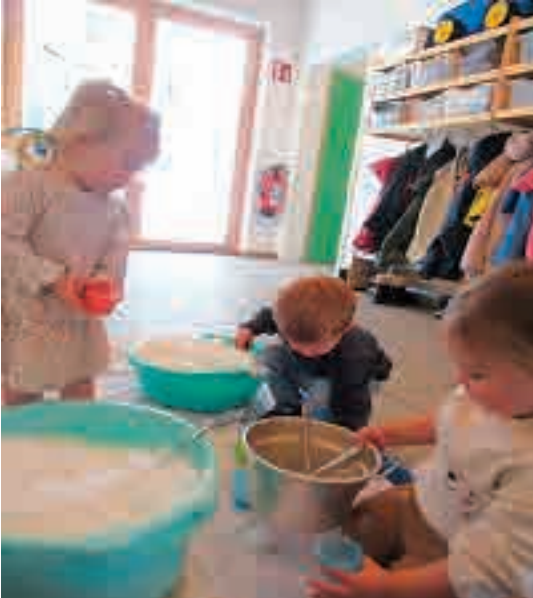
Das erste Schnee-Erlebnis spielte sich bei uns Pusteblumen-Krippenkindern mit Schüsseln, Löffeln und Farbpipetten. Dazu holten wir Schnee zum Experimentieren ins Haus.