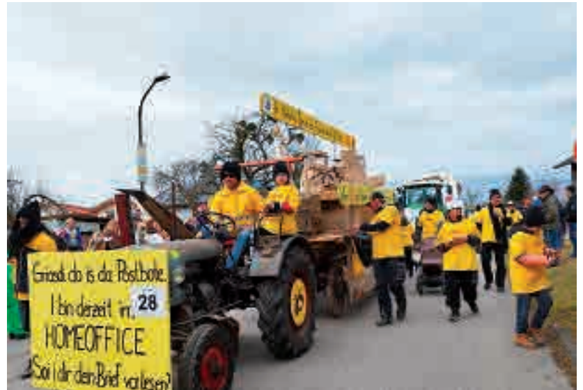
In Kirchsteig kommt die Post wohl nicht so pünktlich