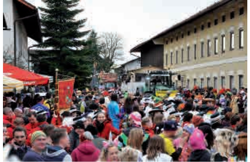
Der eigentlich sonst immer beschauliche Dorfplatz vom Feuerwehrhaus bis zum Maibaum glich einem Hexenkessel