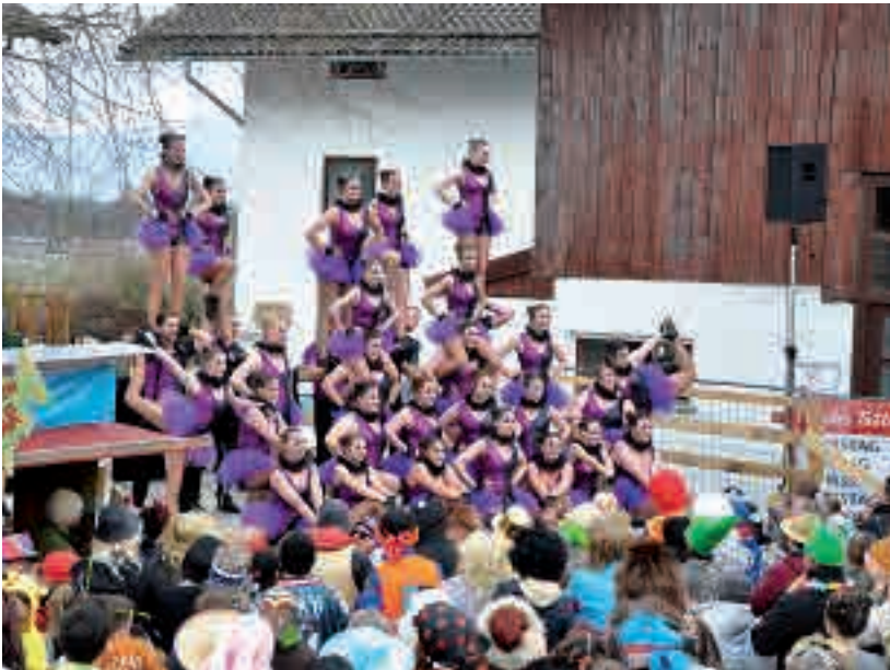
Die Carambas aus Haag begeisterten die Zuschauer mit ihren atemberaubenden Hebefiguren